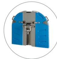
Leicht und stabil: Blattschutz