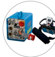
Kompakte Steuerung, hand- liche Funkfernbedienung mit Bildschirm

Die Wandsäge WSE1621 wurde für universelle Anwendungen und den täglichen Einsatz am Bau entwickelt. Das neu konzipierte System setzt dank der digitalen Ausstattungsmerkmale sowie der kompakten und leichten Komponenten neue Standards im Bereich Wandsägen. Der superleichte Blattschutz sowie der Antriebsmotor